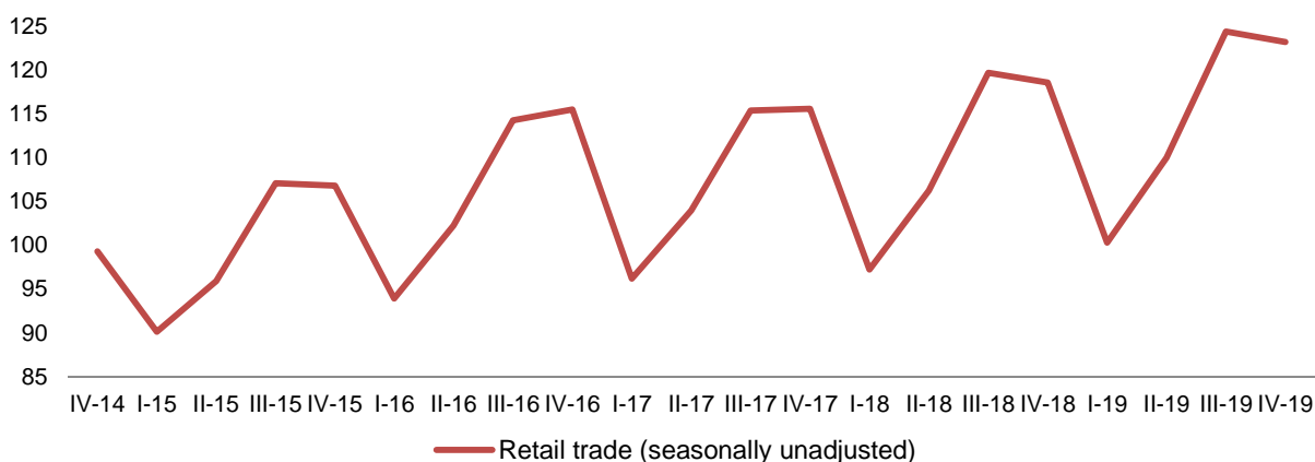
Fig. 1 Indeksi i volumit të shitjeve në tregtinë me pakicë

Tiranë, më 12 Mars : Në tremujorin e katërt 2019, indeksi i volumit të shitjeve në tregtinë me pakicë shënoi 123,2, duke u rritur 3,9 %, krahasuar me të njëjtën periudhë të vitit 2018. Krahasuar me tremujorin paraardhës, ky tregues i përshtatur sezonalisht ka pësuar rënie 0,1 %.