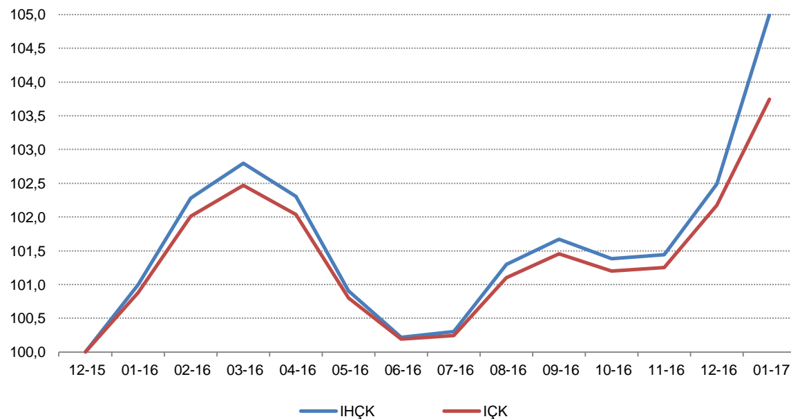
Fig. 1 Krahasimi i ecurisë të IHÇK dhe IÇK-së

Në muajin Janar 2017 ndryshimi mujor i matur nga Indeksi i Harmonizuar i Çmimeve të Konsumit është 2,5 %. Ky ndryshim është ndikuar kryesisht nga rritja e çmimeve të frutave dhe zrazavateve, gazit të lëngshëm për makina, etj.